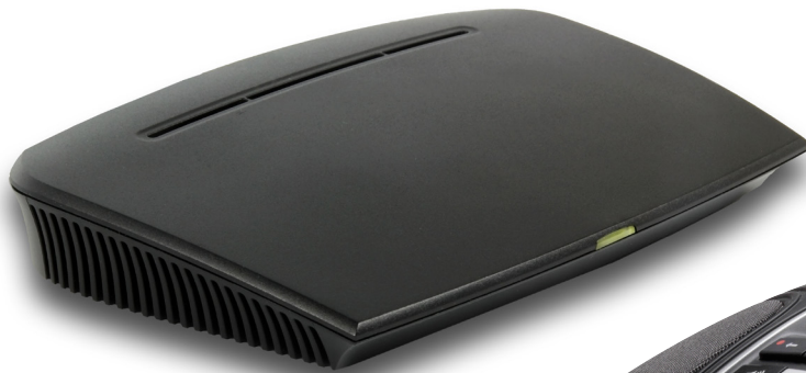
Konftel IP DECT 10